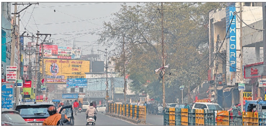
सोनीपत। शाम के समय सोनीपत शहर का नजारा।

मौसम विशेषज्ञों के अनुसार दिन में करीब 3 किलोमीटर प्रतिघंटा की धीमी गति से हवाएं चलती रहीं, जिसके कारण धूप होने के बावजूद हवा में हल्की ठिठुरन बनी रही। मौसम का यह उतार-चढ़ाव आने वाले दिनों में भी जारी रहने की संभावना जताई जा रही है।