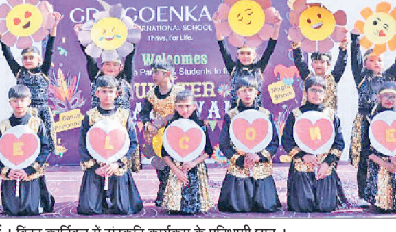
राई। विंटर कार्निवल में संस्कृति कार्यक्रम के प्रतिभागी छात्र।

जी.डी. गोयंका इंटरनेशनल स्कूल में विंटर कार्निवल का भव्य, आयोजन किया गया। विद्यालय परिसर हॉल्लेस, उमंग और रचनात्मक गतिविधियों से सराबोर नजर आया। विंटर कार्निवल के लिए विद्यालय परिसर को विशेष रूप से सजाया गया। रंग-बिरंगी लाइटों, आकर्षक सजावट और थीम आधारित स्टॉल ने कार्यक्रम की शोभा बढ़ाई। प्रवेश द्वार से लेकर खेल मैदान तक हर कोना उत्सव के रंग में रंगा हुआ दिखाई दिया। कार्निवल में विद्यार्थियों द्वारा विभिन्न खेलों के स्टॉल, स्वादिष्ट व्यंजनों के काउंटर, हस्तकला एवं रचनात्मक प्रदर्शनों विशेष आकर्षण का केंद्र रहे। बच्चों ने स्वयं स्टॉल लगाकर