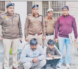
गोहाना। आरोपितों को गिरफ्तार किए हुए पुलिस।