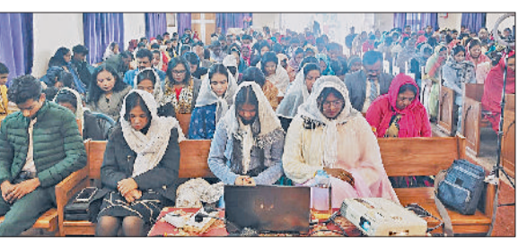
सोनीपत। चर्च में कार्यक्रम के दौरान उपस्थित श्रद्धालुगण।

कतारबद्ध होकर आराधना में भाग लिये। रात के समय प्रभु यीशु के जन्म पर आधारित झांकी के माध्यम से बेथलेहम की घटना का सजीव चित्रण किया गया, जिसे देखकर श्रद्धालु भक्ति हो उठे। दोनों चर्चों में पूरी रात भक्ति गीत गुंजते रहे। प्रभु यीशु की शिक्षाओं, करुणा और प्रेम के संदेश पर आधारित नाटक और सांस्कृतिक कार्यक्रम भी प्रस्तुत किए