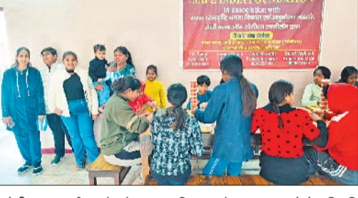
सोनीपत। कार्यक्रम के दौरान जन्मदिन मनाते हुए।