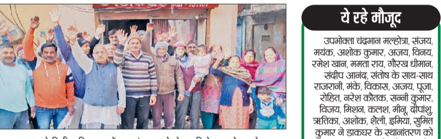
उप डाकघर को मिनी सचिवालय में स्थानांतरण को लेकर विरोध करते उपभोक्ता।

गन्नाौर गांव स्थित उप डाकघर को मिनी सचिवालय में स्थानांतरित किए जाने के मामले में कोट मोहल्लों के दर्जनों उपभोक्ताओं ने विरोध जताते हुए विधायक से हस्तक्षेप की मांग की। उपभोक्ताओं ने चेताया कि यदि उप डाकघर को वर्तमान स्थान से हटाया जा तो इससे आमजन, विशेषकर बुजुर्गों, महिलाओं, दिव्यांगों और आर्थिक रूप से कमजोर वर्ग को भारी परेशानी उठानी पड़ेगी। लोगों ने बताया कि यह उप डाकघर वर्तमान में गन्नाौर गांव के कोट मोहल्ला, गढ़ी केसरी, वाल्मीकि मोहल्ला, डकैत मोहल्ला, कुम्हार मोहल्ला,