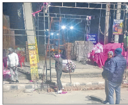
सोनीपत। रात के समय आयोजन स्थल से टेंट उतारते हुए।

संबंधित सभी आवश्यक अनुमतियों के लिए विधिवत आवेदन किया जाएगा और तब प्रक्रिया पूरी करने के बाद ही कार्यक्रम आयोजित होगा। समिति ने बताया कि फिलहाल अनावरण स्थगित रखते हुए सरकार से सहयोग लेने का निर्णय लिया गया है।