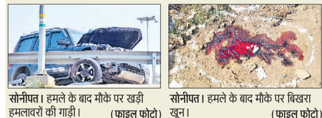
सोनीपत। हमले के बाद मौके पर खड़ी हमलावरों की गाड़ी। (फाइल फोटो)